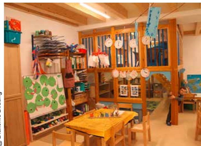
@ Diakonie Bildung

Die pädagogischen Grundprinzipien sind selbstverständlich die gleichen geblieben und wurden am Tag der Elementarbildung (24.1.2019) präsentiert. Interessierte, Eltern und Fachkundige konnten so vor Ort einen Einblick in das Kindergartengeschehen gewinnen.